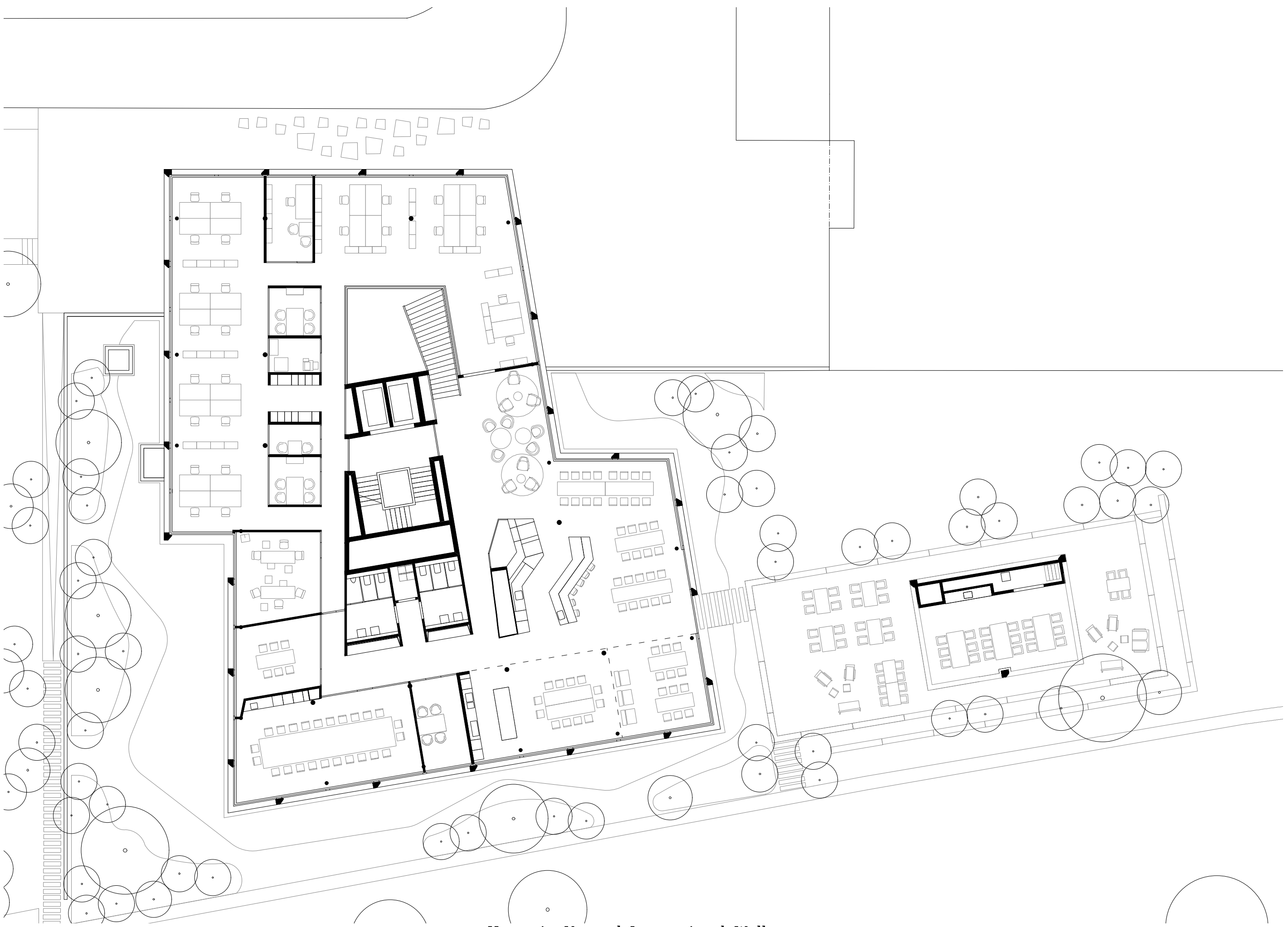
Hauptsitz Vorwerk International, Wollerau Grundriss 1. Obergeschoss